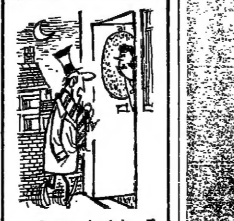
متنافس يا عزيزي لمرودي مغلغلا من المباراة .. لقد سهوت قمت

بدأت مباريات دور الثمانية في كأس المانيا الغربية بفراشات قوية . فقد خرج من المباراة نادي باير ميونيخ بطل اتنية أوروبا بعد هزيمته من نادي هيسا برلين ٢ - ٤ . كذلك كانت اعجب المفاجآت هزيمة نادي اينتراخت فرانكفورت الحائز على الكأس في العام الماضي من احد اتنية الدرجة الثانية ٢ - ١ . تعادل منتخب الأوروغواي مع فريق نمسوي بالكرة تعادل منتخب الأوروغواي لكرة القدم مع فريق « اوستريا » النمساوي ١ - ١ في المباراة الودية التي اقيمت بينهما في ملعب مونتهفيديو امام ٦٠ الف متفرج .